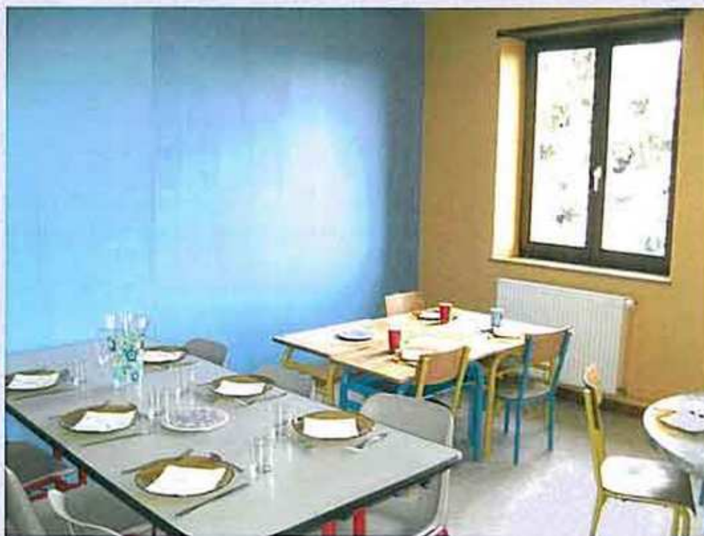
Salle de cantine