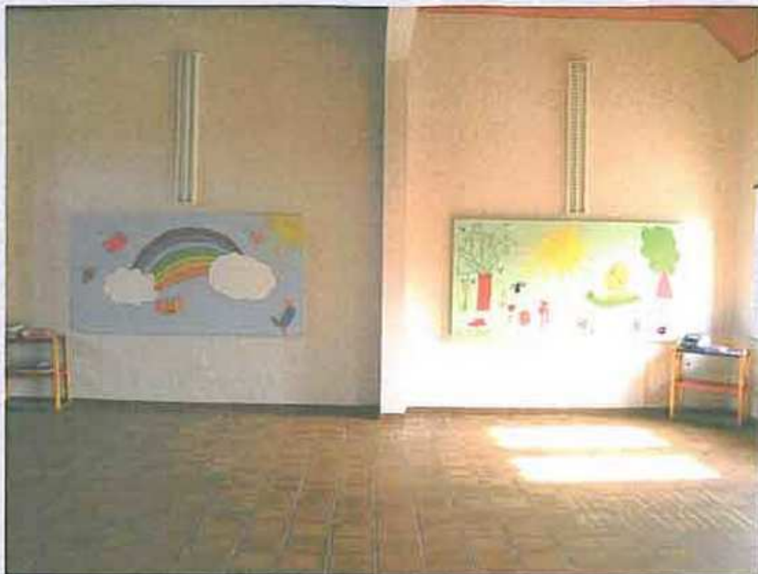
Grande salle de jeux – Tableaux peints par les enfants